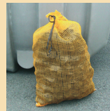
Filet filtrant SPHEROFLO®